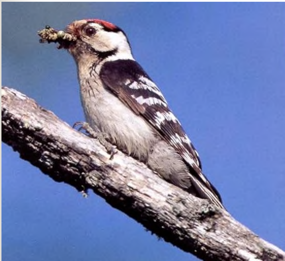
БОЛЬШОЙ ПЕСТРЫЙ ДЯТЕЛ