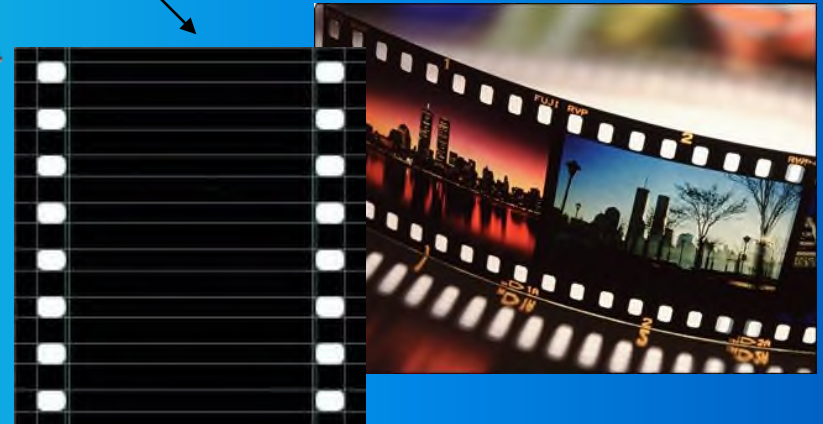
фотоплёнки и киноплёнку